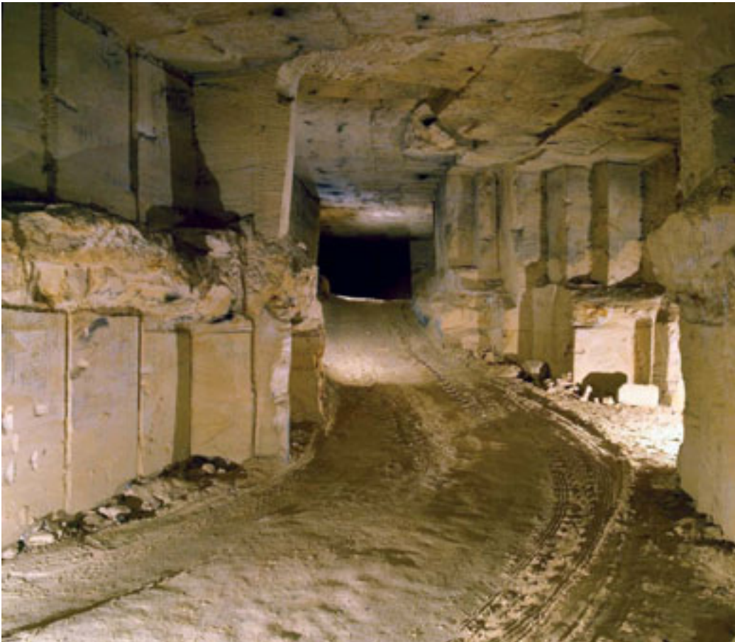
5 – NEGENTIENDE EEUWS GROEVELANDSCHAP IN DE GEMEENTEGROT VAN VALKENBURG, IN 2007 AANGEWZEN ALS BESCHERMD RIJKSMONUMENT VANWEGE ZIJN REPRESENTatieve EN ONGESCHONDEN KARAKTER.

van menselijke interactie met het landschap.