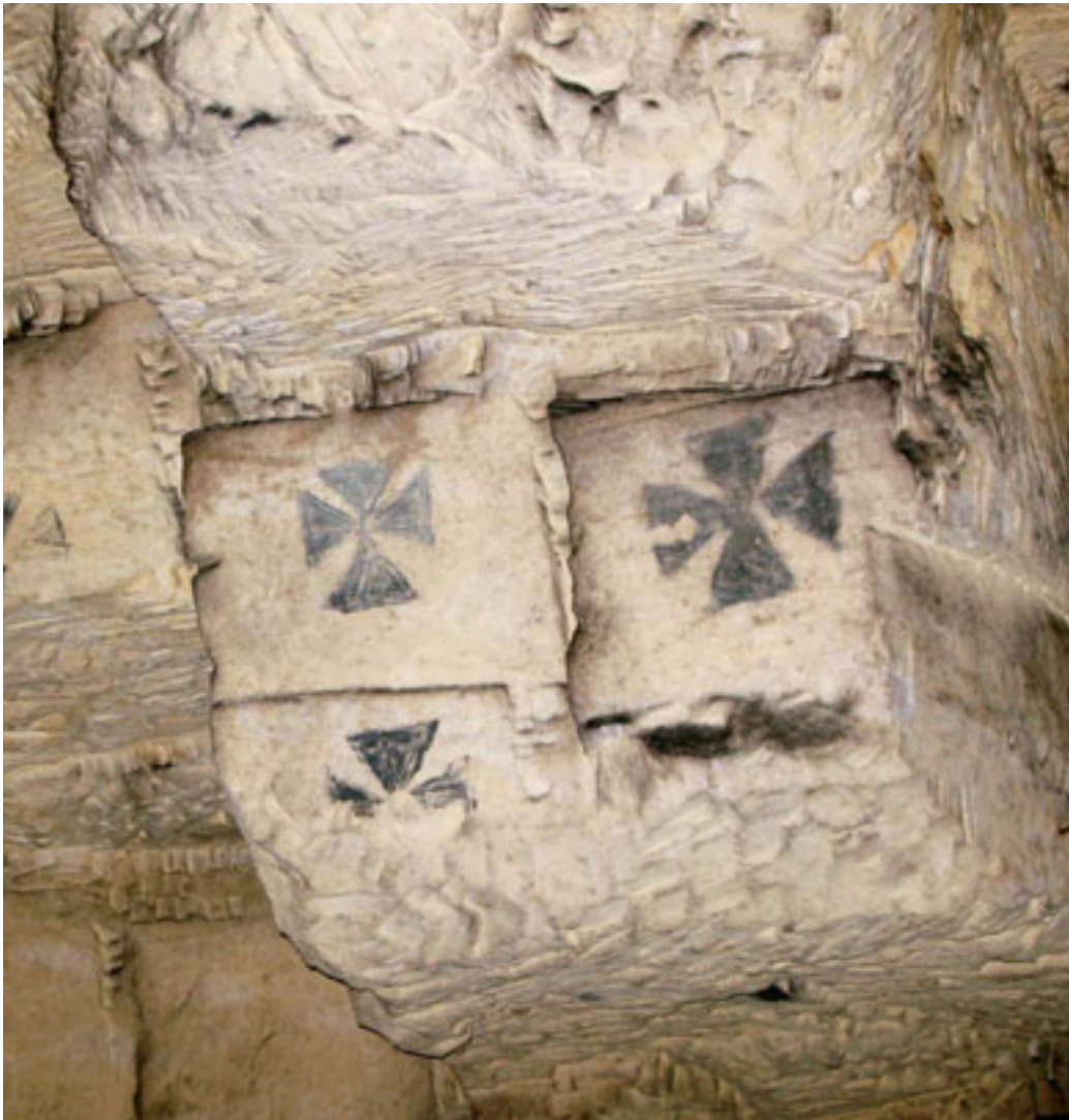
9 - 16E EEUWSE CONCESSIONSMARKERINGEN AAN HET EINDE VAN EEN ONTGINNING. GEMEENTEGROEVE, VALKENBURG AAN DE GEUL.

het ontsluiten van boven- en ondergrond als synthese van een gezamenlijke ontstaans- en ontwikkelingsgeschiedenis een ingewikkelde zaak wanneer het gaat om nationaal, regionaal en plaatselijk beleid ten aanzien van de verschillende onderdelen van zo een gebied. Illustratief is het voorbeeld van het Plateau van Caestert. Dit plateau ten zuiden van Maastricht maakt deel uit van de Sint Pietersberg, die van oudsher de grens vormt tussen twee taalgebieden c.q. culturen. Tegenwoordig lopen zelfs drie grenzen over het plateau; die tussen Nederland, Vlaanderen en Wallonië. Hoewel het terrasrestant zelf door de aanwezigheid van een groot potentieel aan erfgoedwaarden een UNESCO-werelderfgoedstatus waardig zou zijn, wordt het terrasrestant als zodanig niet als één geheel beschermd. Aan Nederlandse kant is het stukje Caestert, met ondergronds een groot areaal aan bijvoorbeeld middeleeuwse kunstuitingen op de wanden van de ondergrondse groeve niet beschermd.