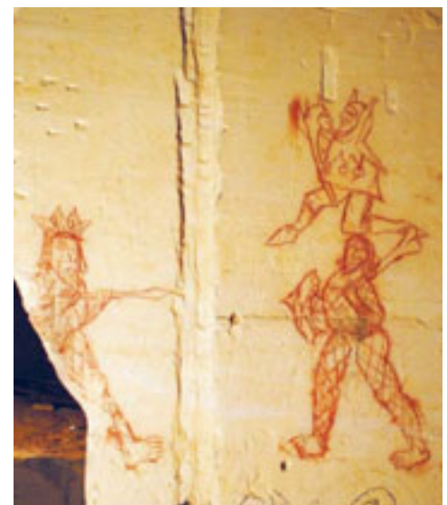
7 – LAAT MIDDELEEUWSE SYMBOLISCHE TEKENING DIE MOGELIJK VERWIJST NAAR INITIATIERITEN VAN DE BLOKBREKERS. CAESTERTGROEVE, SINT PIETERSBERG.

doorgaans hoger ingeschatte geologische waarden van de groeve als landschapselement. Als gevolg van mijnbouwactiviteit zijn doorgaans aardlagen aan de oppervlakte gebracht die men elders niet ziet. Het verschil in waardestelling is afhankelijk van de aard van de site, maar zeer zeker ook van de instantie die de site beheert. Onterecht worden deze plaatsen vaak eerder als geologisch- of zelfs natuurmonument gezien en worden de cultuurhistorische elementen van ondergeschikt belang geacht.