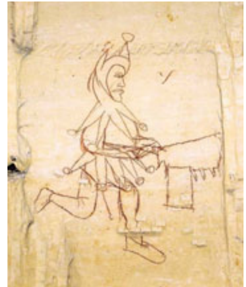
6 – LAAT MIDDELEEUWSE TEKENING VAN DE BLOKBREKER ALS NAR (15E EEUW). DE TEKENING IS MOGELIJK EEN SOCIAAL WAARMERK GEGEVEN DOOR EEN BUITENSTAANDER. FOTO: JAC DIEDEREN

Hoewel ontstaan als gevolg van het ingrijpen van de mens in het landschap, behoren dagbouwontginningen doorgaans eerder tot het aardkundig c.q. natuurkundig erfgoed dan dat zij tot cultuurhistorisch- of industrieel erfgoed worden gerekend. Dit heeft te maken met de