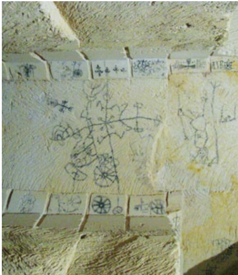
4 – LAAT MIDDELEEUWSE RELIGIEUZE SYMBOLIEK OP ÉÉN VAN DE PLAFONDS IN DE CAESTERTGROEVE, SINT PIETERSBERG.

voor. De mergelgroeven vormen in die zin het negatief van de gebouwen die met de mergelsteen werden gebouwd. De ruimten die ondergronds achterbleven hebben vooral als landschap minstens zo een grote erfgoedwaarde als de historische bouwwerken aan de oppervlakte.