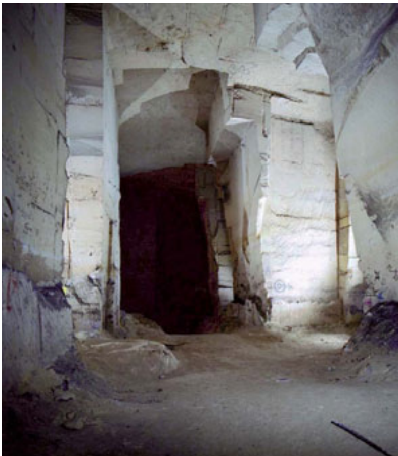
3 – MIDDELEEUWS GRENSOVERSCHRIJDEND GROEVELANDSCHAP (15E EEUW) CAESTERTGROEVE, SINT PIETERSBERG, FOTO: MICHAEL FOEDROWITZ