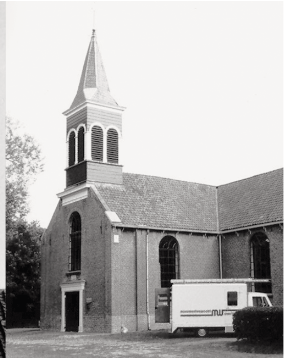
6 – IN DE BEGINFASE. LINKS: WACHTERS MOGEN GEEN HOOGTEVREES HEBBEN RECHTS: EERSTE INSPECTIEBUS OVERIJSEL (1984)