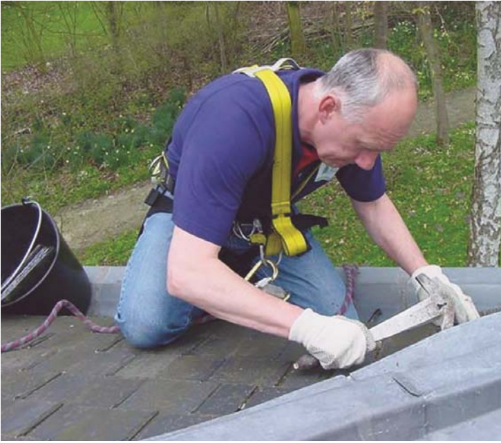
8 – KLEINE REPARATIES AAN DE ORANGERIE ZEEDUIN IN OOSTKAPELLE.

en aangesloten bij Monumentenwacht Nederland.