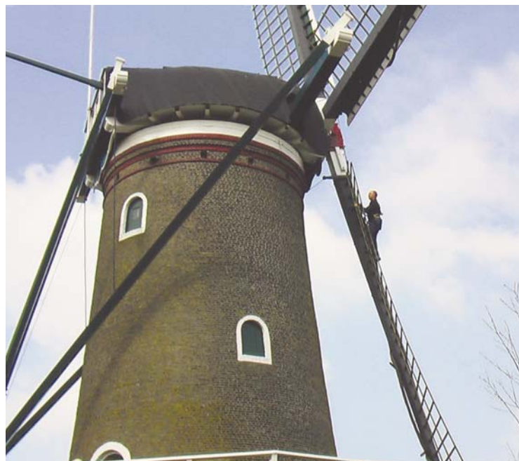
7 – HALSBREKENDE TOEREN BIJ MOLENINSPECTIE MAARTENSDIJK ZEELAND.

helder in kaart gebracht. Reden voor de Rijksoverheid c.a. om behoorlijk te investeren in dit museum, ook om daarmee een slechtere situatie te voorkomen.