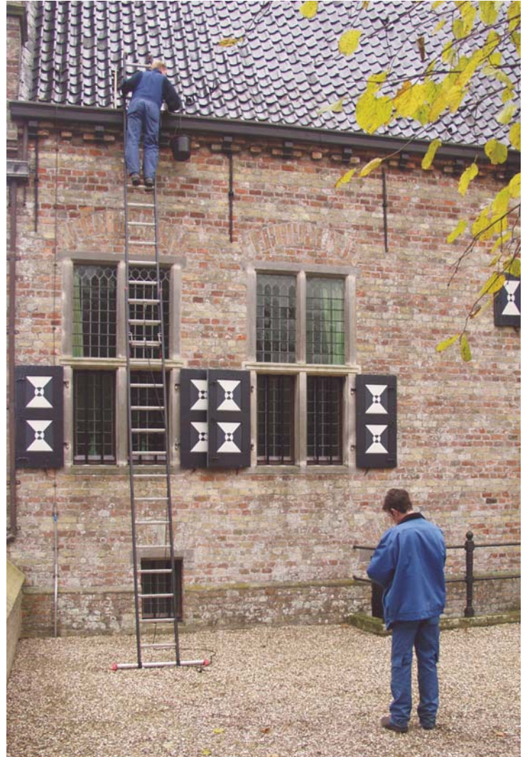
9 – MONUMENTENWACHT FRYSLÂN INSPECTEERT A. POPTASLOT.

monument in het landschap en het ontsluiten ervan voor het publiek. Ontsluiten in de zin van het verhaal vertellen, maar soms ook het fysiek toegankelijk maken.