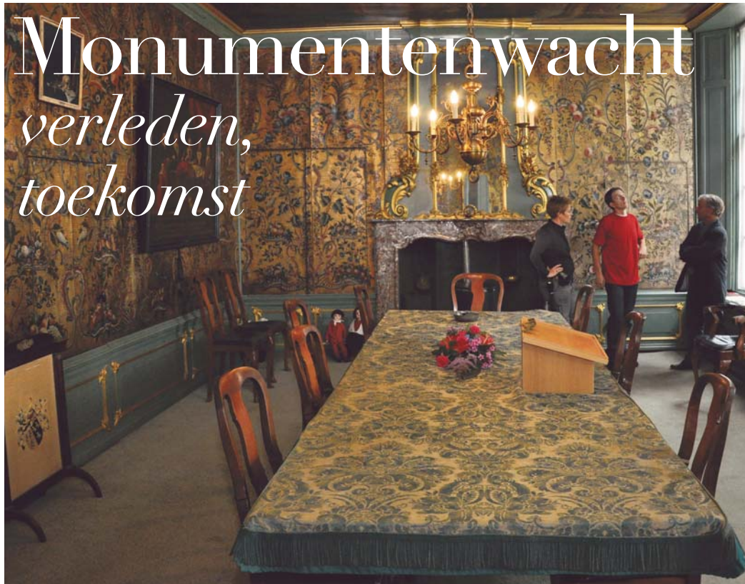
1 - INTERIEURINSPECTIE BURGERWEESHUIS ZIERIKZEE

De Monumentenwacht is een niet meer weg te denken organisatie die sterk heeft bijgedragen aan het in stand houden van menig monument en doet dat nog steeds. De Monumentenwacht heeft de zorg voor monumenten een ander gezicht gegeven. De monumentenzorg is mede daardoor aan het veranderen van een curatieve naar een preventieve zorg. Maar hoe en wanneer is het begonnen? Er was een lange aanloop. Hoe heeft het zich ontwikkeld en hoe ziet de toekomst eruit?