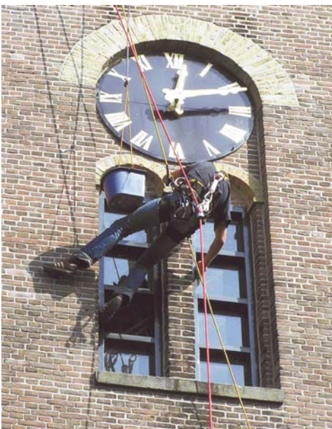
3/4 – BOVEN: INSPECTIE JACHTSLOT ST. HUBERTUS / MIDDEN: DE KUNST VAN HET ABSEILEN.