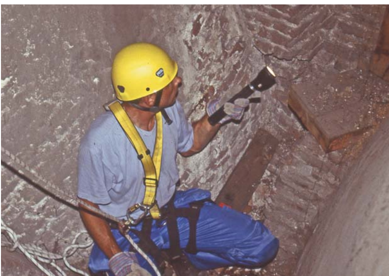
5 – INSPECTIE CONSTRUCTIE VAN DE KAP ST. JORISKERK AMERSFOORT.

bestuur. De koepelorganisatie Monumentenwacht Nederland bleef in stand met behulp van een rijksbijdrage en een bijdrage van de deelnemende stichtingen. De provincies ontvingen van het rijk een extra (niet gelabelde) donatie aan het provinciefonds, de monumentenwachten ontvingen een subsidie van hun provincie (meer taken, meer geld) en de andere geldstroom bestond uit de bijdragen van de abonneehouders.