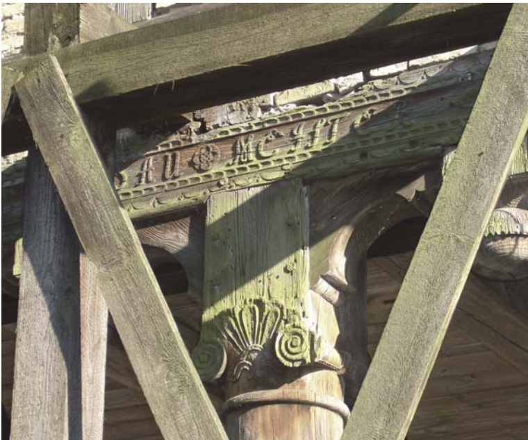
8 – DETAIL VAN KAPITEEL VAN ARCADEBOERDERIJ IN MARYNOWY

Het Nederlandse aandeel in de historische karakteristieken van de Wijseldelta is beperkt. Hij is vooral in de structuur van het landschap te herkennen; hij zit in de rationele verkaveling en het watermanagement. Ook de terpen in de laaggelegen delen hebben een