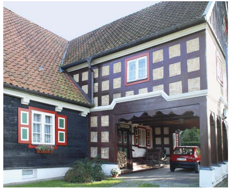
9 – GERESTAUREERDE ARCADEBOERDERIJ IN ŻUŁAWKY (VH. FÜRSTENWERDER) FOTO: CORTEN, 2008