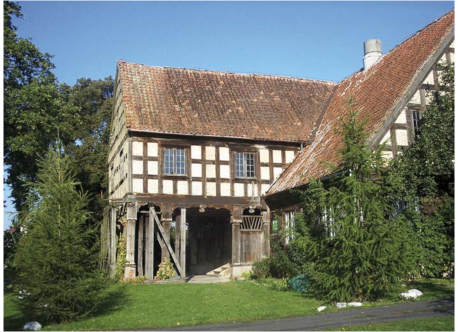
7 – ENTREE VAN DE ARCADEBOERDERIJ IN MARYNOWY