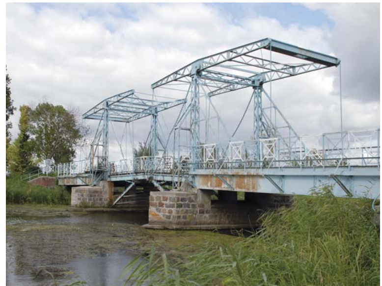
11 – IJZEREN OPHAALBRUG OVER HET AFWATERINGSKANAAL IN DE POLDER KLEIN-MARIËNBURG