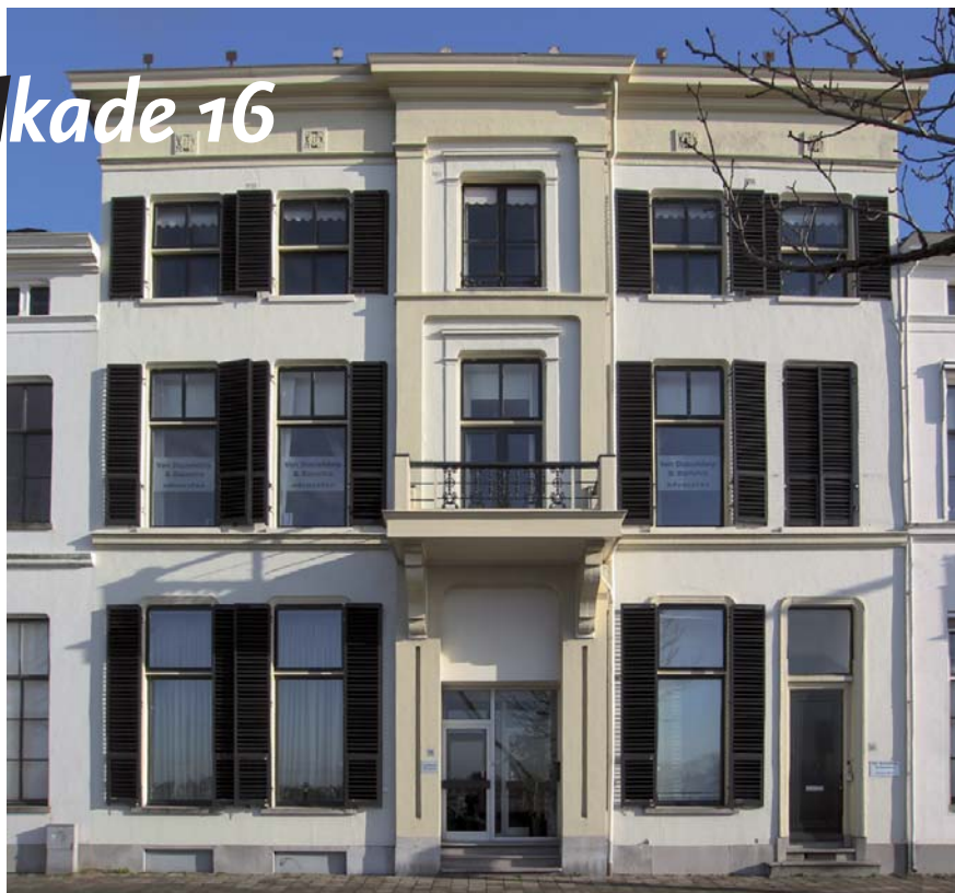
Statige voorgevel van IJsselkade 16 te Zutphen

Omdat IJsselkade 16 een bijzonder onderdeel is van een monumentale gevelwand, zal de gemeente uiteraard kritisch meekijken wat betreft de planvorming. Naast de onderhouds- en restauratiewerkzaamheden (zowel extern als intern) worden op