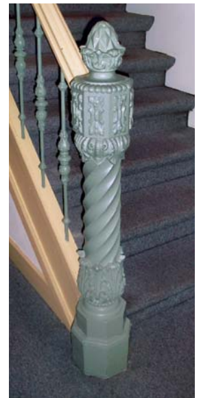
Trappaal van de monumentale trappartij met bovenlicht.

In ieder project zijn er zaken die niet standaard als 'fiscaal aftrekbare onderhoudskosten' worden aangemerkt zoals bijvoorbeeld de meeste onderhoudswerkzaamheden aan het interieur. Door in het cultuur- en bouwhistorisch onderzoek een waardensetting op te nemen (die tevens voor het vergunningstraject wordt ingezet) kunnen, zoals bij IJsselkade 16, ook werkzaamheden aan de monumentale trappartij of het historische hijswiel als fiscaal aftrekbaar worden opgevoerd. Ook het herstel van de afwerklaag in het pand dat normaal niet aftrekbaar is, wordt geaccepteerd, mits er sprake is van gevolgwerkzaamheden, van bijvoorbeeld onderhoud ten gevolge van lekkage, scheuren et cetera. Op basis van 'Fiscaal verhaal ® IJsselkade 16' is in