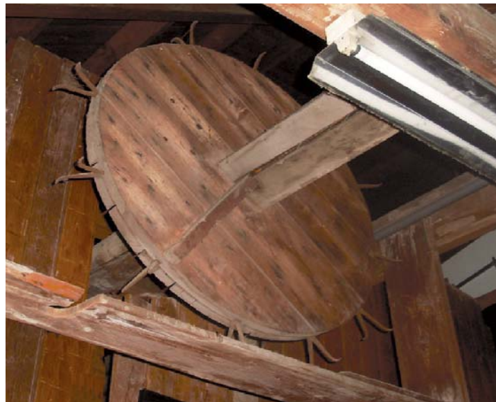
Oorspronkelijke hijswiel onder de kap.

De eigenaar van IJsselkade 16 kan genieten van de combinatie van fiscaal voordeel en de laagrentende lening. De analyses (cultuur- en bouwhistorische analyse en de conditierapportage aangevuld met een kostenraming) die Res nova en Friso Woudstra Architecten hebben uitgevoerd zijn dusdanig opgesteld dat zij niet alleen ingezet kunnen worden