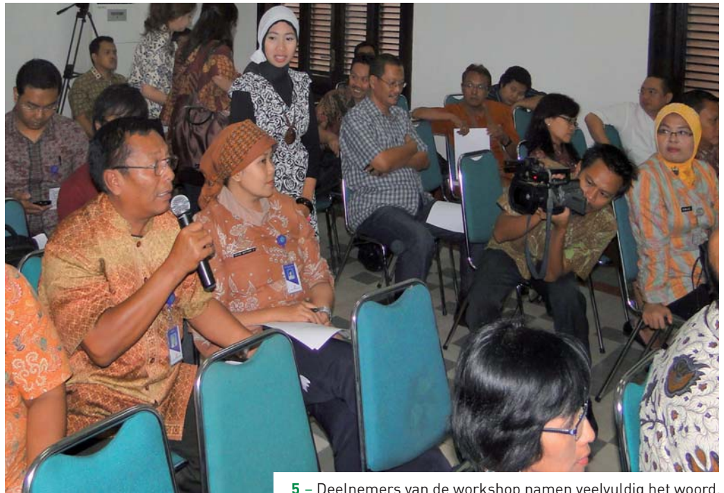
5 – Deelnemers van de workshop namen veelvuldig het woord.

Deze vraag om behoud door ontwikkeling sluit uitstekend aan op het RCE-project 'Erfgoed dat weer beweegt', waarin een 'erfgoedonderne-