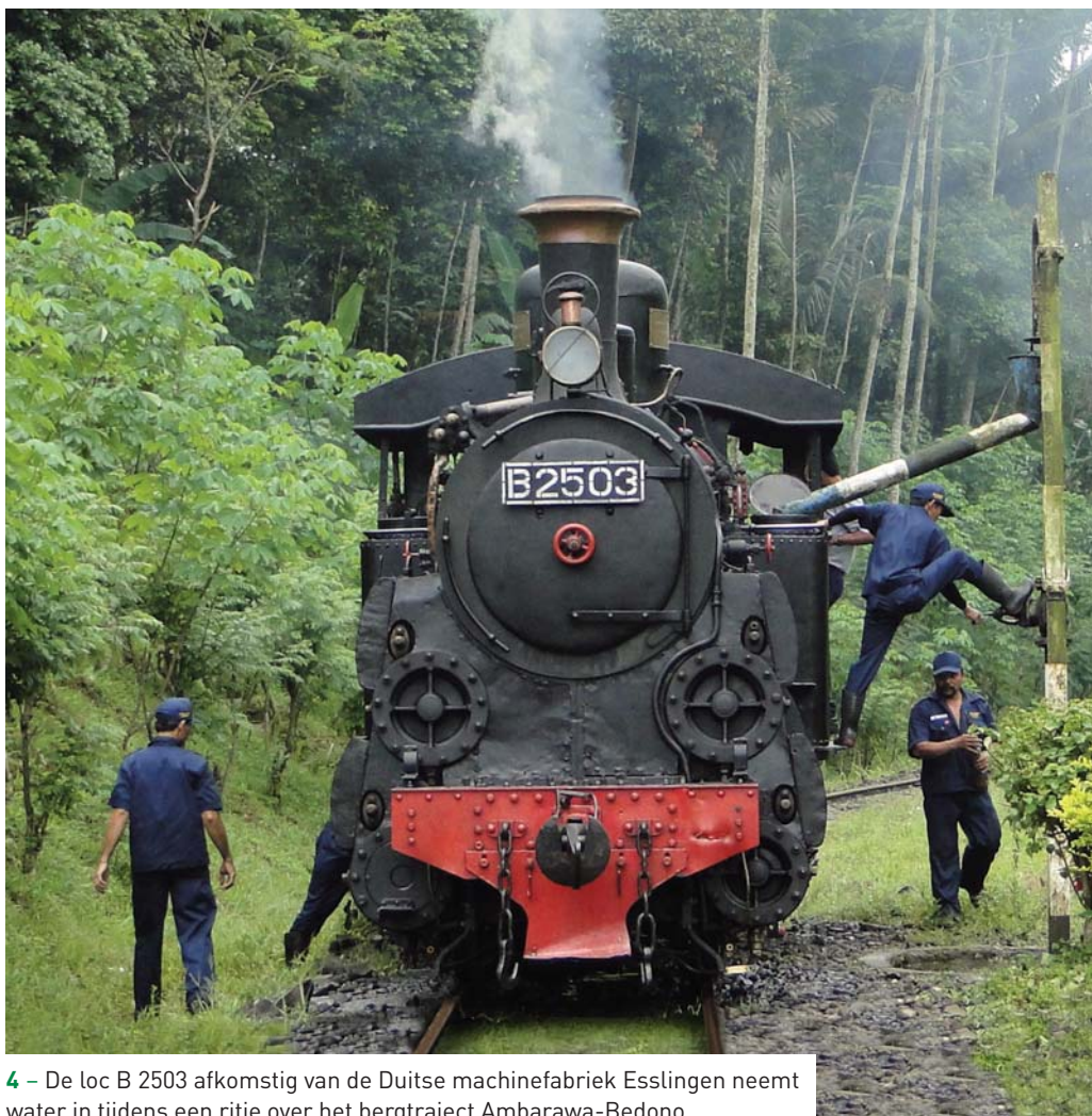
4 – De loc B 2503 afkomstig van de Duitse machinefabriek Esslingen neemt water in tijdens een ritje over het bergtraject Ambarawa-Bedono.

Nadat de Nederlandse economie enigszins was aangetrokken, groeide het enthousiasme van de staat om zelf te bouwen en werd in 1875 de Staatsspoorwegen (SS) opgericht, met als doel het binnenland verder te ontsluiten, de bevolking betere vervoersmogelijkheden te bieden en de cultuurondernemingen versneld te ontwikkelen. Het eerste project dat de SS onder handen nam, was de aanleg van een spoorweg tussen de belangrijke haven en marinestad Surabaya en Malang. Door tegenstanders werd het als 'Rijksplezierbaan' (1878) gekwalificeerd. De tijd zou echter leren dat hier de basis werd gelegd voor één van de meest succesvolle lijnen uit de spoorweghistorie op Java: de zogenaamde Vlugge Vijf. Rond 1935 werd dit snelle openbaar vervoer onder de aandacht van het brede publiek gebracht met slogans als: '(...) Bliksemschicht, krachtgedicht, fut in 't lijf, Vlugge Vijf. Of: Van Bandoeng naar Batavia voor zaken of plezier; geen betere gelegenheid dan met de Vlugge Vier '. Of: ' Berg en dal, waterval, ravijn en rots, S.S. trots. (...) '. 7 Hoge bruggen, viaducten en rails van amper een meter breed werden bereden door de snelste trein van het zuidelijke halfmond. Aan de vooravond van de Tweede Wereldoorlog had het spoorwegnet een totale lengte van 7.500 km; 5.500 km op het dichtbevolkte Java en Madura, de rest op Sumatra 8 . Sinds het uitroepen van de onafhankelijk-