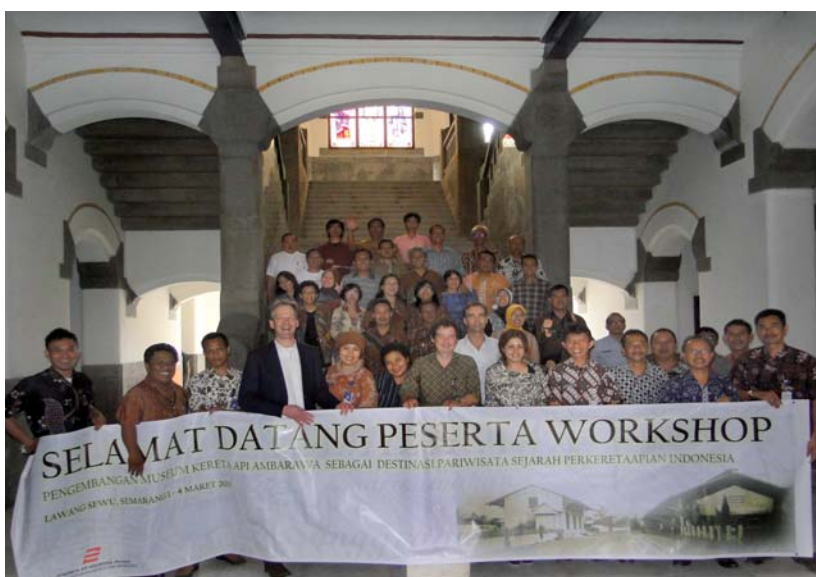
2 – De ruim vijftig Indonesische deelnemers aan de workshop zijn in de centrale hal van het Lawang Sewu-gebouw vereeuwigd. FOTO PT KERETA API 2011

Indië pas in 1867. Parlementaire ruzies tussen conservatieve en liberale politici en andere belanghebbenden waren een belangrijke reden voor de late introductie van stoomtractie in de