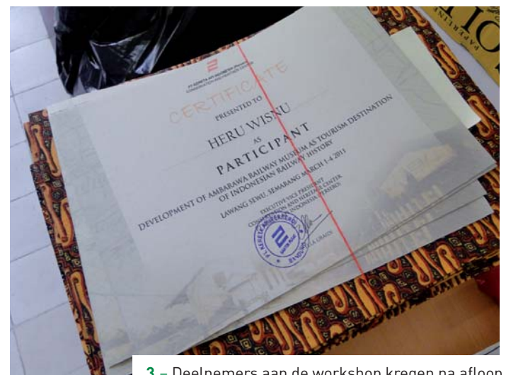
3 – Deelnemers aan de workshop kregen na afloop een certificaat van de PT. Kereta Api.