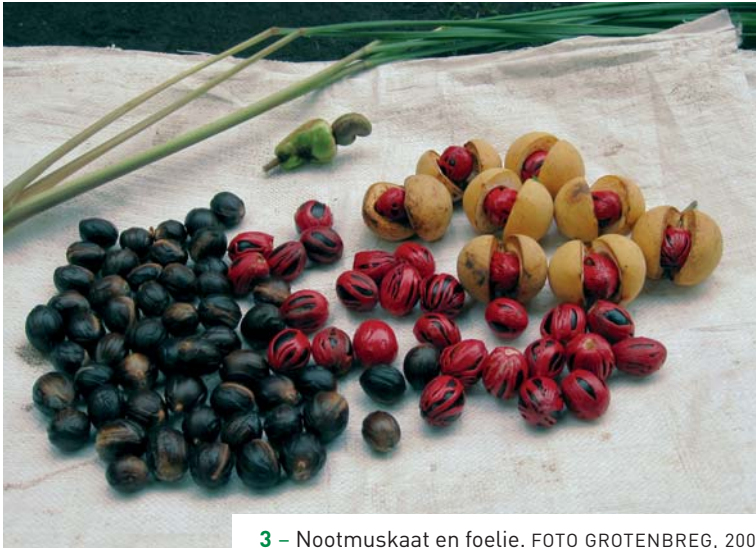
3 – Nootmuskaat en foelie.