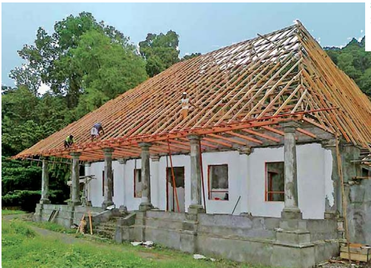
8 a-b – Reconstructie van Spantje By in uitvoering. 2010