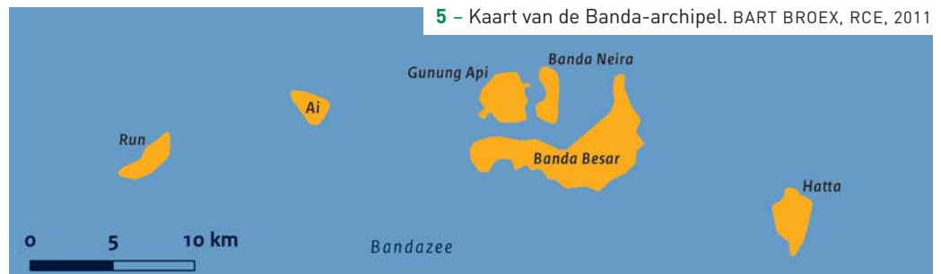
5 – Kaart van de Banda-archipel.