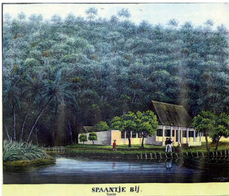
2 – Tekening van Spantje By.

Het was nog altijd onrustig op de Molukken toen wij onze reis aanvingen. We schrijven oktober 2001 en ons reisdoel was de Banda-archipel; een groep van zes minuscule eilandjes te midden van de gelijknamige zee, zo'n 150 zeemijlen verwijderd van Ambon. Als exclusieve leverancier van nootmuskaat – een gewild specerij met evenveel bewezen als vermeende eigenschappen – vormden de eilandjes eeuwenlang een bron van grote welvaart. Dat wil zeggen, voor wie zich de productie wist toe te eigenen. Even lang vormden zij eveneens een bron van afgunst en conflict. En daarmee is hun legendarische rol in de wereldgeschiedenis meteen verklaard.