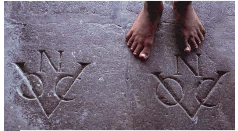
4 – Vloertegel in de kerk van Banda Neira met het monogram van de VOC. Opmerkelijk in de 'N' boven het monogram, die vermoedelijk duidt op Neira. Normaliter was deze plek in het monogram voorbehouden aan de kamers van de VOC. FOTO GROTENBERG, 2009

In juni 2010 is het gereconstrueerde hoofdhuis van het perk Spantje By feestelijk opgeleverd. Dit perk was altijd al een van de mooiste en productiefste nootmuskaatplantages van de Banda-archipel. De reconstructie vormt niet alleen een waardevolle herinnering aan een legendarische periode uit de wereldgeschiedenis, maar is tevens een mijlpaal in de revitalisering van de nootmuskaatteelt in de Molukken.