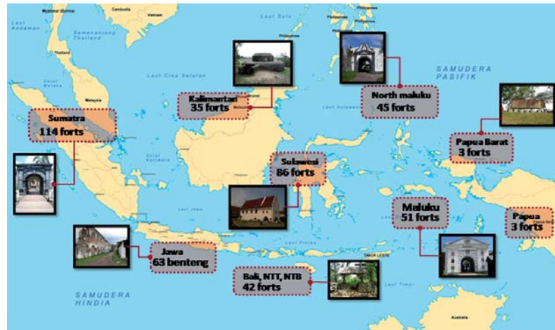
2 – De verspreiding van de bestaande forten over de Indonesische archipel. (NTT= Nusa Tenggara Timur; NTB = Nusa Tenggara Barat).

Tussen 1500 en 1945 werden langs de belangrijkste handels- en zeeroutes in de Indonesische archipel vele militaire versterkingen en forten gebouwd. Ze verzezen in alle soorten en maten, 442 in totaal, het merendeel gericht op de inheemse vijand. In opdracht van het Indonesische ministerie van Cultuur en Toerisme zijn deze verdedigingswerken tussen 2007 en 2010 geïnventariseerd en uitgebreid gedocumenteerd. De resultaten zijn raadpleegbaar via een database. Bovendien staat er een tentoonstelling over deze monumentale verdedigingswerken op stapel.