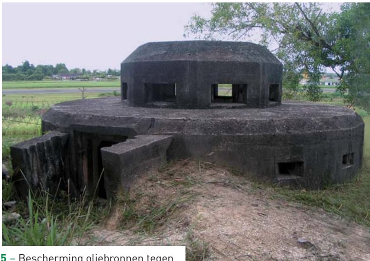
5 – Bescherming oliebronnen tegen Japanse invasie: Nederlandse bunker op vliegveld Tarakan.