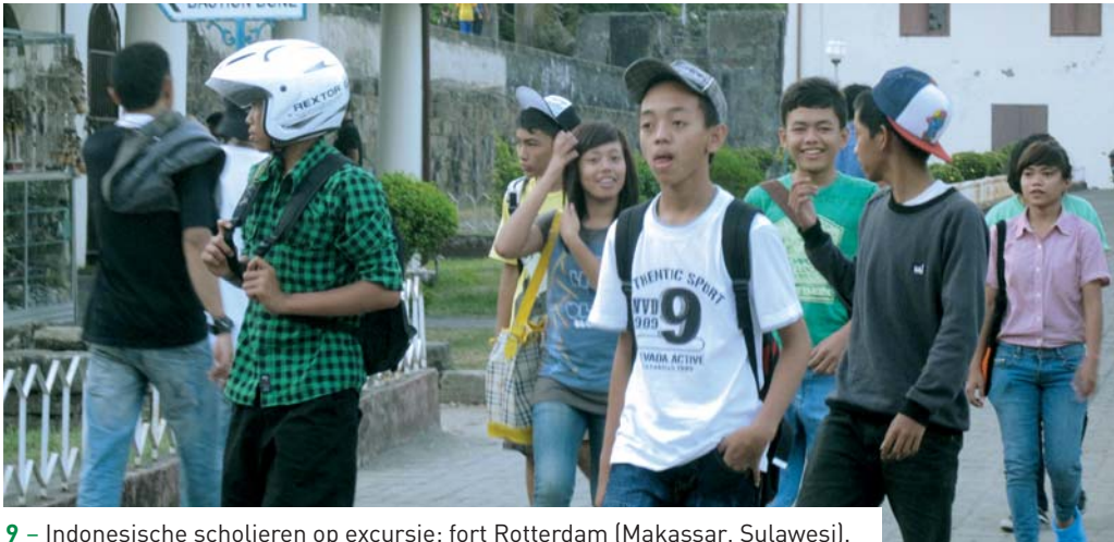
9 – Indonesische scholieren op excursie: fort Rotterdam (Makassar, Sulawesi).

van de archeologische sites zijn de locaties en de fysieke omstandigheden onvoldoende bekend. Budpar besloot daarom in 2005 alle forten in de Indonesische archipel te lokaliseren en systematisch te beschrijven. Een eerste bureauonderzoek leverde een lijst van 270 bestaande forten op, maar het was duidelijk dat het er meer moesten zijn. Er was bovendien nauwelijks iets bekend over de verdedigingswerken uit de Tweede Wereldoorlog.