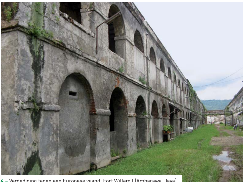
4 – Verdediging tegen een Europese vijand: Fort Willem I (Ambarawa, Java).

Na de Eerste Wereldoorlog groeide Japan uit tot een industriële grootmacht, maar was daarvoor afhankelijk van de import van grondstoffen en olie uit Nederlands-Indië. In Batavia vreesde