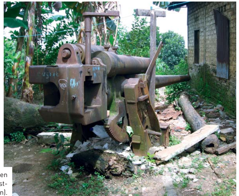
6 – Japanse verdediging tegen geallieerde invasie: Japans kustgeschut (Air Salobar, Ambon).

men dat de Japanners zich meester zouden maken van de belangrijkste oliehavens in Balikpapan en Tarakan op Borneo en daarom werden er garnizoenen gelegerd en kustbatterijen gebouwd. Na het uitbreken van de Tweede Wereldoorlog werden ook op Ambon en Java militaire versterkingen aangelegd. Het KNIL bleek tijdens de inval in 1942 geen partij voor het mobiele Japanse leger en haar luchtoverwicht, waardoor Nederlands-Indië al op 8 maart 1942 moest capituleren.