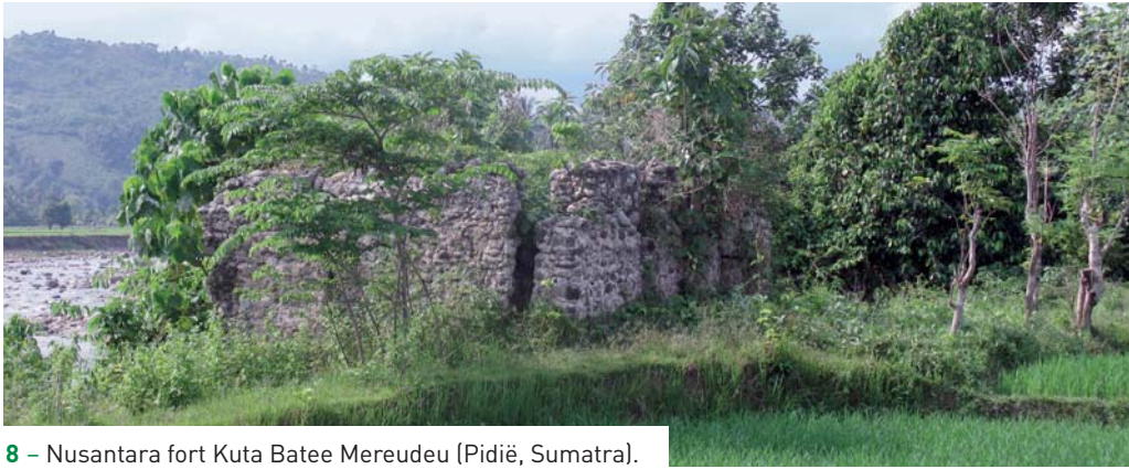
8 – Nusantara fort Kuta Batee Mereudeu (Pidië, Sumatra).