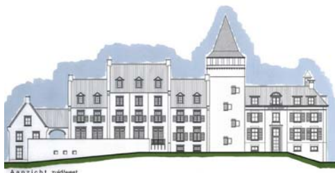
Havezate Hohenzollern, een schilderachtige opzet volgens de uitgangspunten van de pondération (ontwerp C. Janssen, FWA).

De Achterhoek is een gebied dat bekend staat om zijn landgoederen en havezaten. Bij het creëren van een nieuw landgoed in de sfeer van onze historische roman rond Hohenzollern, ligt het dan ook voor de hand om allereerst hier inspiratie te zoeken voor de gebouwtypologie. Havezaten als Huis Bergh (het verblijf van de familie Hohenzollern) kenmerken zich door een schilderachtig beeld dat het resultaat is van een organisch groeiproces: een dergelijk kasteel is