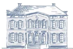
Friso Woudstra Architecten bna