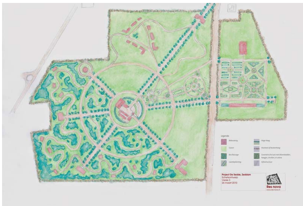
Voorontwerp voor de ruimtelijke inrichting van resort Hohenzollern dat aansluit op de historische gelaagdheid van de plek en het huidige landschap (ontwerp M. Bangert, Res nova).

een historisch gegroeid complex. Bij het ontwerp van een nieuwe havezate is het de taak van de architect om dit evenwicht te bereiken door doelbewust in te zetten op 'pondération': compositorisch evenwicht tussen de samenstellende onderdelen, waarbij bouwmassa's van ongelijke grootte met elkaar gekoppeld en in balans gebracht kunnen worden.