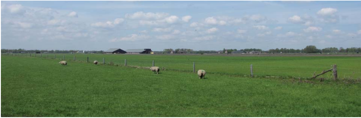
9 - VRIEZENVEEN ALS KARAKTERISTIEK RUILVERKAVELINGSLANDSCHAP. UIT ONDERZOEK BLIJKT DAT HIERACHTER ONVERMOEDE WAARDEN SCHUILGAAN.