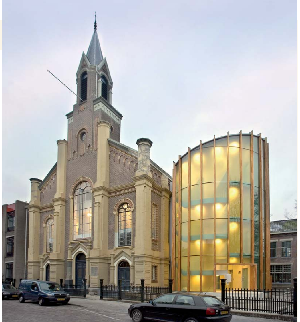
9 DE REMONSTRANTSE KERK IN GRONINGEN UIT 1883 WERD IN 2006 VERBOUWD DOOR ARCHITECTE MORIKO KIRA VOOR EEN DUBBELFUNCTIE: MULTIFUNCTIONEEL BRUIKBARE KERKRUIMTE EN KANTOOR VOOR DE STICHTING OUDE GRONINGER KERKEN.

Gewaardeerd worden herbestemmingen die op een fraaie manier recht doen aan de karakteristieken van het gebouw en die inhoudelijk aansluiten op de historische betekenis ervan, in dit geval dus het kerkelijke gedachtegoed. Het gaat dan om functies in de richting van zorg, cultuur, studie en maatschappelijke – niet commerciële – bijeenkomsten, of een combinatie daarvan. De wens om godsdienstige functies – al of niet gedeeltelijk – te handhaven in kerkgebouwen lijkt de laatste tijd toe te nemen. De ruimte voor creatieve experimenten met nieuwe functies lijkt overigens gering. De herbestemming van kerkgebouwen blijkt ondanks de secularisatie nog altijd een gevoelige zaak. Het vinden van de meest optimale herbestem-