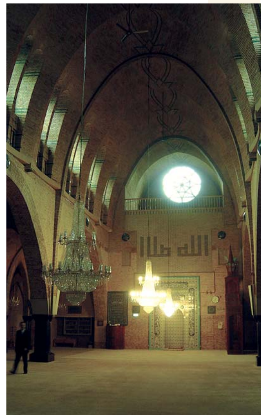
8 DE RK IGNATIUSKERK VAN ARCHITECT H.W.VALK UIT 1927, OP DE ROZENGRACHT IN AMSTERDAM, KREEG IN 1981 EEN NIEUWE BESTEMMING ALS TURKSE AL FATIHMOSKEE.

De diverse overheden denken bij de begroting voor erfgoed alleen nog aan een kostenpost, die niet te hoog mag oplopen. Ze realiseren zich niet dat het behoud van erfgoed en een goede zorg hiervoor, een directe economische waarde vertegenwoordigt, en dus wel een investering waard is. Dit wordt mooi geschetst in het recente onderzoek van Tom Bade en Gerben Smid: ‘Eigen haard is goud waard’ . Cultuur